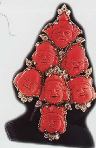
Pendente raffigurante visi orientali, in oro, diamanti taglio brillante. Van Cleff parigi 1950