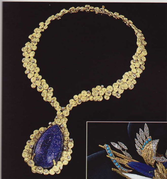
Collana in oro, diamanti taglio brillante, cabochon di lapislazzuli. Chaumet parigi 1960

Malgré sa maîtrise en jurisprudence et dix ans d'activité et d'expérience dans ce domaine, elle décide de tout abandonner pour se consacrer à