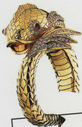
Bracciale raffigurante pesce in oro, rubini, diamanti taglio brillante. Boucheron parigi 1950.