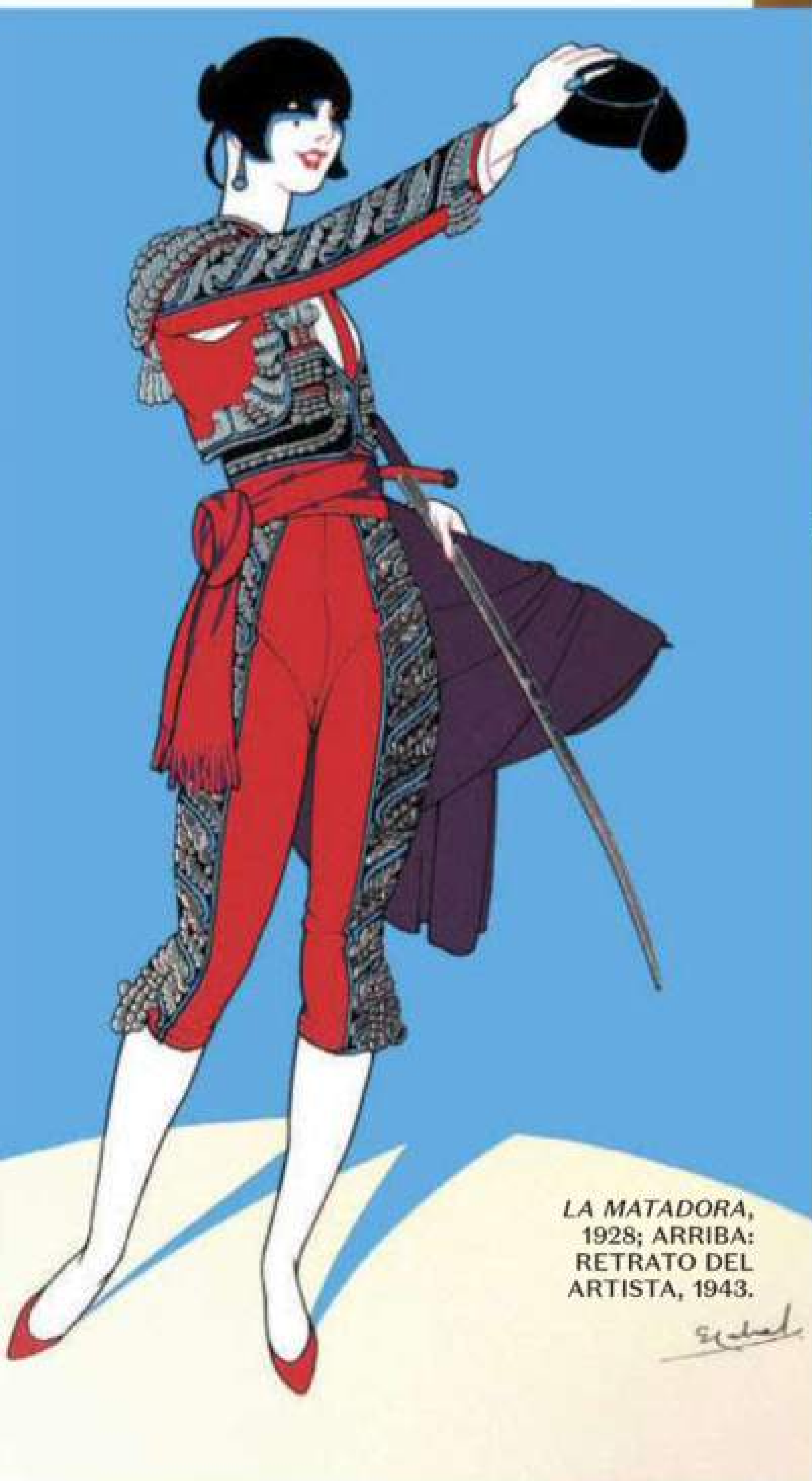
LA MATADORA, 1928; ARRIBA: RETRATO DEL ARTISTA, 1943.