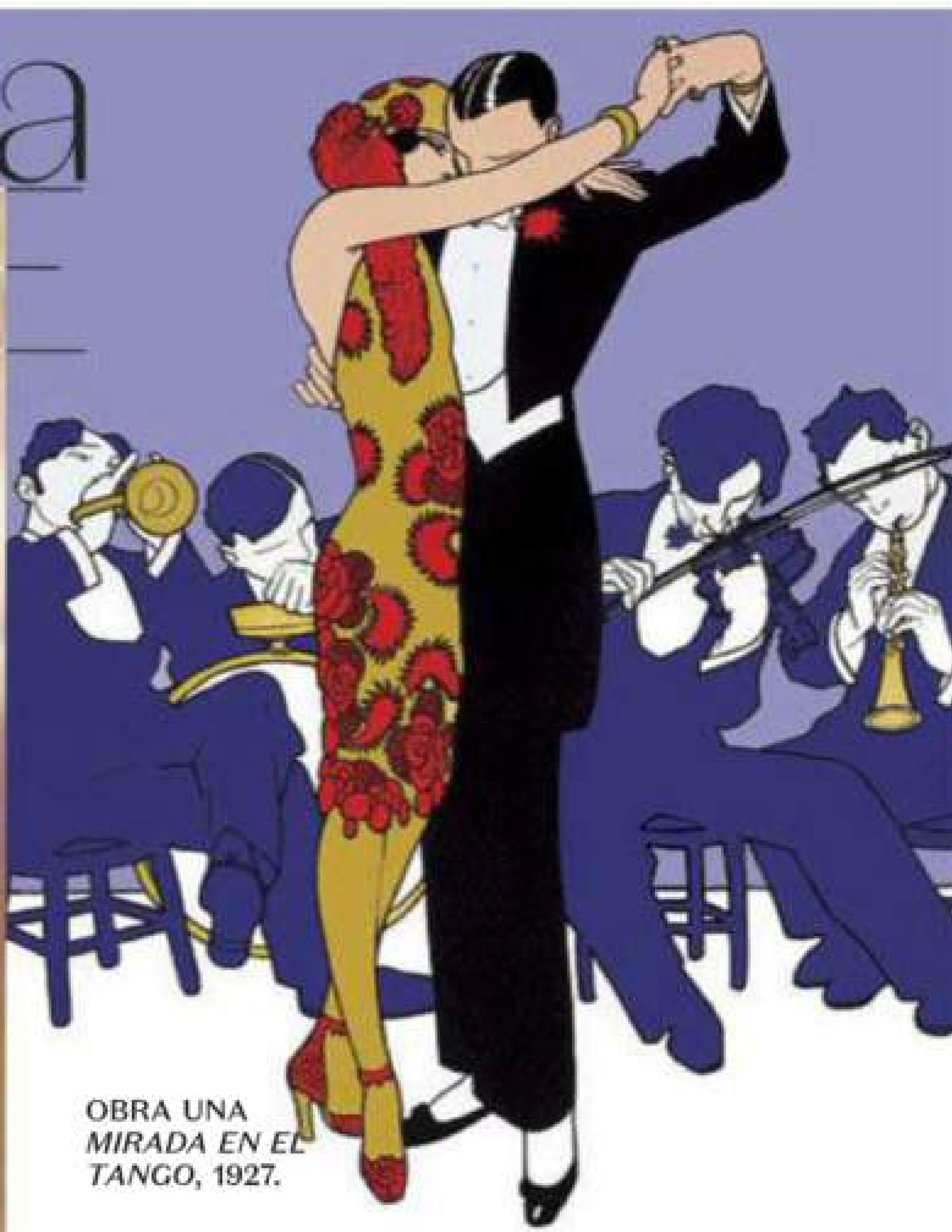
OBRA UNA MIRADA EN EL TANGO, 1927.